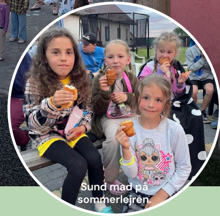
Sund mad på sommerlejren.

Vores indsatsområder er sundheds- og tandpleje, ernæring til undervægtige børn, rehabiliterende sommerlejre, fødevareuddeling og oplysningsarbejde om HIV/AIDS, narkotika og menneskehandel. Sådan er vi med til at forebygge sygdomme og underernæring. Og sådan sikrer vi, at flere får mulighed for at leve et sundere og mere værdigt liv.