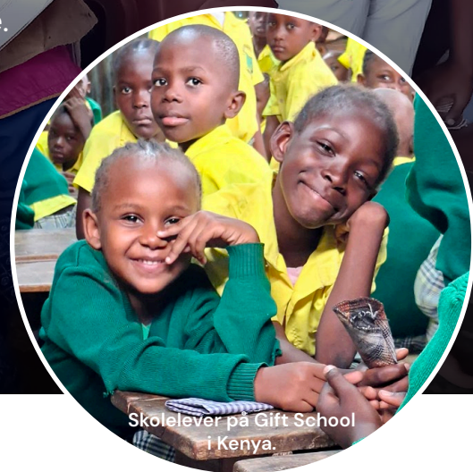
Skolelever på Gift School i Kenya.

Vi ønsker at se generationer, der vokser op til at blive trygge, ansvarlige mennesker – klar til at bidrage til en bedre og mere bæredygtig verden.