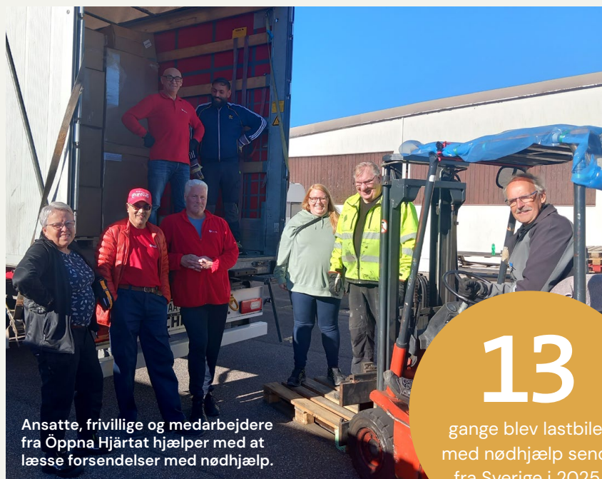
Ansatte, frivillige og medarbejdere fra Öppna Hjärtat hjælper med at læsse forsendelser med nødhjælp.