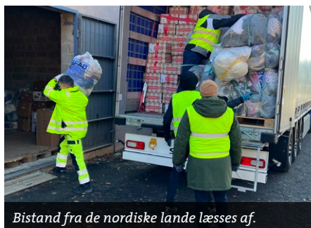
Bistand fra de nordiske lande læsses af.

– Jeg var faktisk ikke bekymret. Det kan man nok ikke være, hvis man vil have mit job. Children's Mission arbejder steder, hvor situationen er urolig og svær. Men jeg var ekstra forsigtig med forholdsreglerne. Jeg ville ikke bo i en by, så jeg sov i en teltseng på Children's Missions kontor, som ligger ude på landet. Der var strømafbrydelser, og der blev nogle gange lukket for