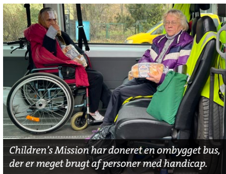
Children's Mission har doneret en ombygget bus, der er meget brugt af personer med handicap.