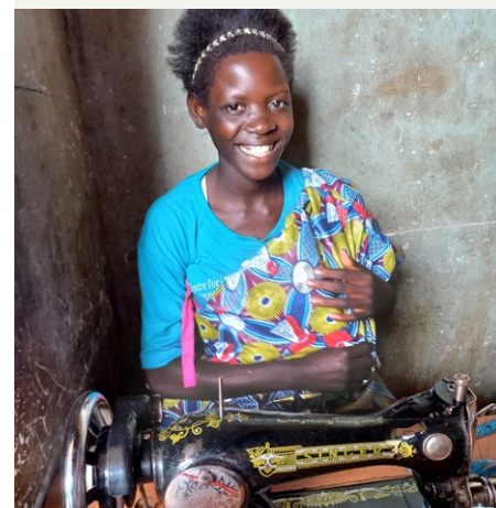
Kvinde i Uganda under uddannelse i syning.