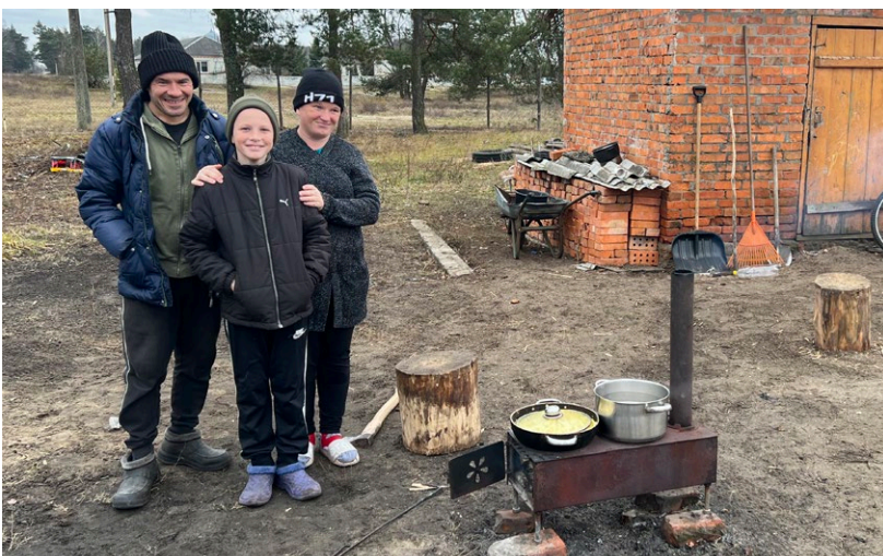
Children's Missions komfur giver både varme og mulighed for madlavning ved strømafnydelse.