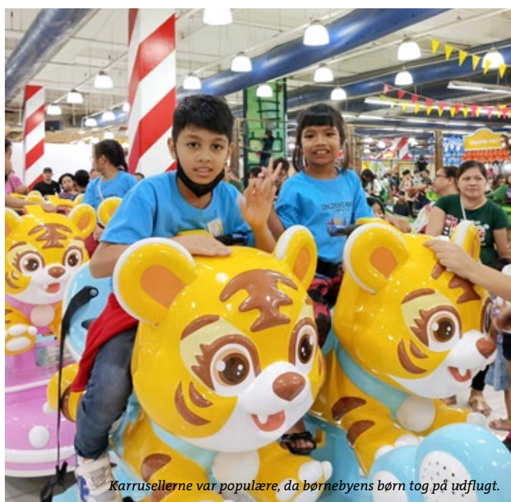
Karussellerne var populære, da børnebyens børn tog på udflugt.