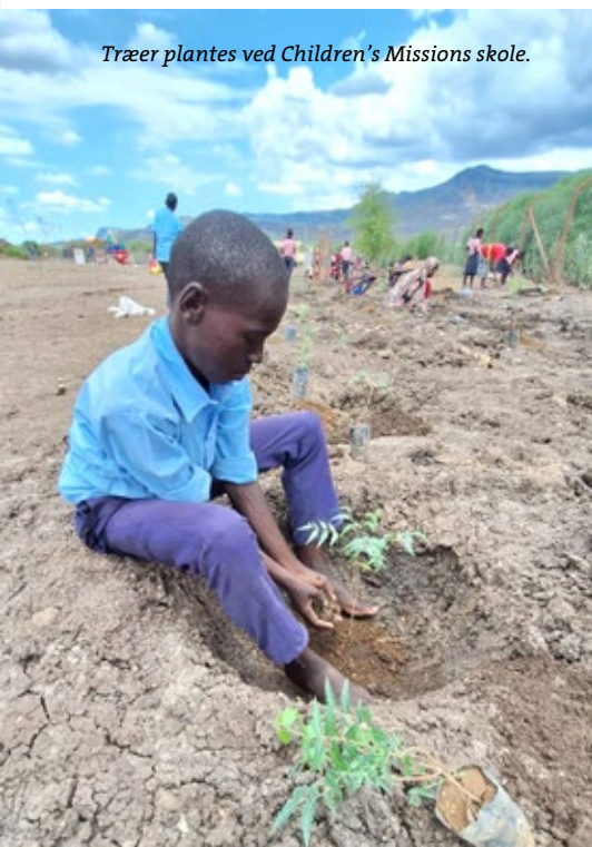
Træer plantes ved Children's Missions skole.

– Jeg er så taknemmelig til Gift School for al den hjælp, jeg har fået, og til Children's Missions alle givere, der gør det muligt for børn som mig at gå i skole og få hjælp til uddannelse.