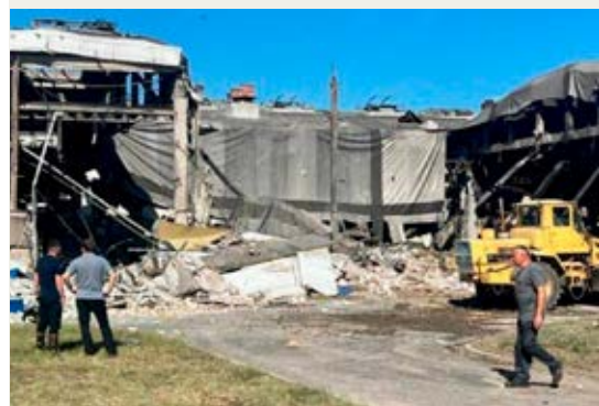
Svenskejede SKF's kuglelejerfabrik i Lutsk blev angrebet og tre mennesker blev dræbt.