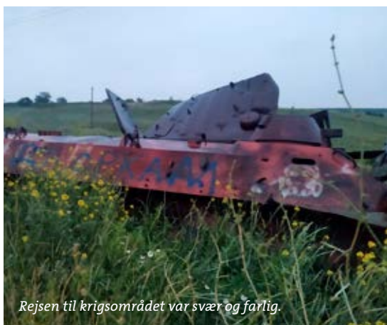
Rejsen til krigsområdet var svær og farlig.

Landsbyboerne var meget taknemmelige for hjælpen. Borgmesteren fortalte, at Children's Mission var blandt de første, der kom med hjælp til byen, og at ovnene fra Sverige er en kostbar skat.