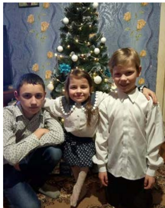
Angelina drømte om at møde en helt, der ville se hende, selv om hun er så kort, og give hende en dejlig gave som den første af alle børnene.