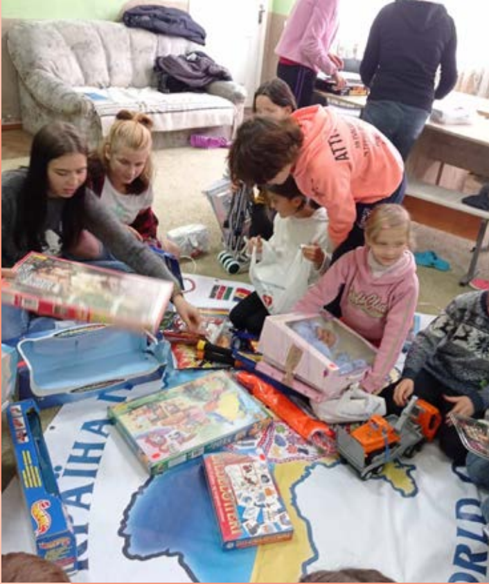
Da Children's Mission besøgte børnene på børnehjemmet i Rozhyshche, uddelte de spil og legetøj, men spredte frem for alt glæde og håb.