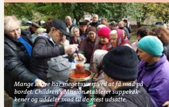
Mange ældre har meget svært ved at få mad på bordet. Children's Mission etablerer suppekøkkener og uddeler mad til de mest udsatte.

HJÆLPEN FRA NORDEN fortsætter med at nå frem til Ukraine og blive uddelt der. Siden begyndelsen af året har Children's Mission i Ukraine modtaget 32 forsendelser med alt fra tøj og sko, møbler, tekstiler, genoptræningsudstyr og medicinsk udstyr. 66 cykler blev fragtet i en lastbil fra Norge og delt ud til trængte skolebørn. Cyklerne blev kørt ud til deres modtagere på traditionel vis – med hest og vogn.