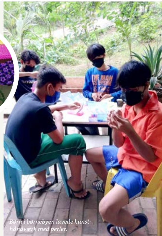
Børn i børnebyen lavede kunsthåndværk med perler.