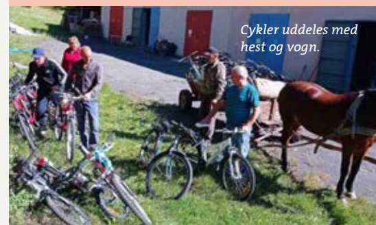
Cykler uddeles med hest og vogn.