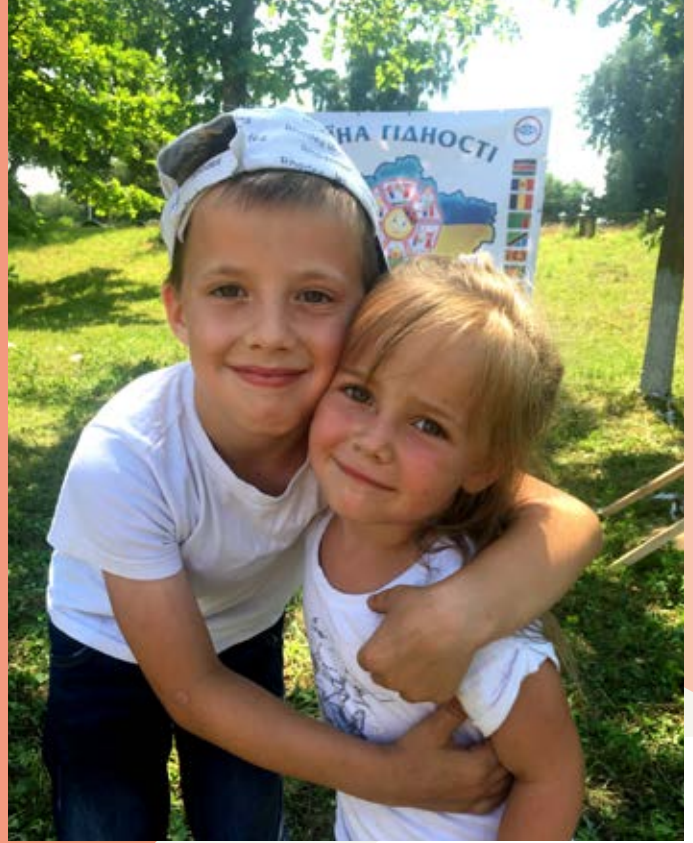
Hver uge arrangerer Children's Mission i Ukraine aktiviteter, hvor de hjælper børn.