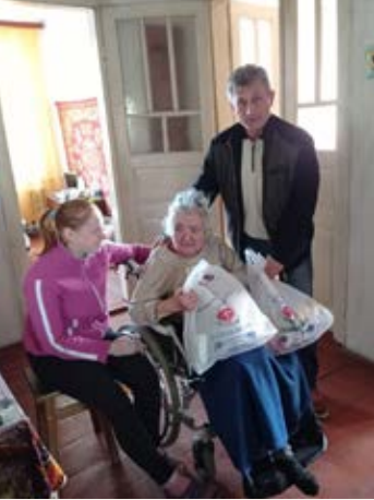
Hjemmebesøg hos de ældre betyder meget. Children's Mission kommer ikke kun med fødevarer, men også med omsorg, kærlighed og håb.