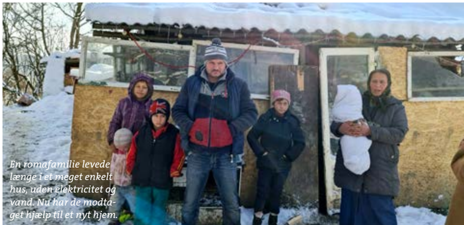
En romafamilie levede længe i et meget enkelt hus, uden elektricitet og vand. Nu har de modtaget hjælp til et nyt hjem.

CHILDREN'S MISSION hjælper også en romafamilie med hele tolv børn i alderen fire måneder til 17 år. De levede længe under uværdige forhold i et meget enkelt hus, uden elektricitet