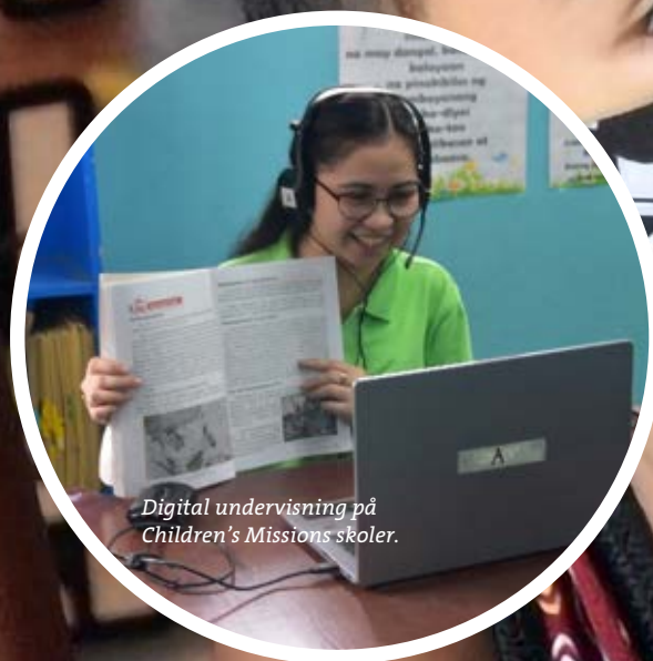
Digital undervisning på Children's Missions skoler.