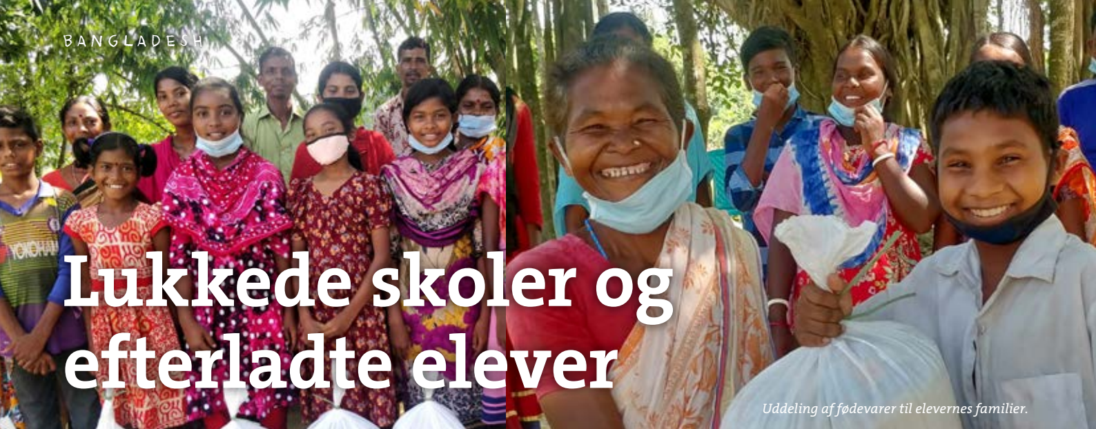
Uddeling af fødevarer til elevernes familier.