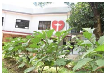
Dyrkning af grøntsager i børnebyen.

eleverne kan kommunikere og diskutere via digitale platforme. De elever, der ikke har adgang til internettet og elektroniske hjælpemidler, kan selv læse hjemme. Hver mandag kommer læreren hjem for at give undervisningsmateriale og opgaver, som eleverne kan arbejde med i løbet af ugen.