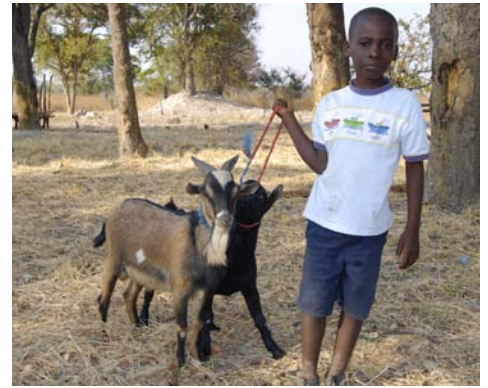
En lille dreng har fået to længe ventede geder til familien.

Children's Mission har siden 2007 haft samarbejde med Apostolic Church of Pentecost (ACOP) i Zambia. ACOP har et stort socialt arbejde i flere landsbyer, primært i Mpongwe regionen, som ligger ca. 300 km nord for hovedstaden Lusaka.