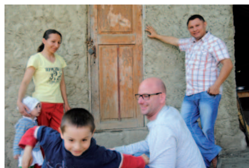
Hjemmebesøg hos en af de familier, som vi støtter.