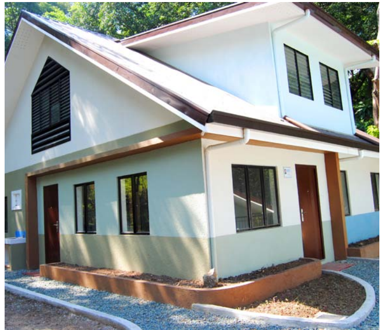
Fra "Hills of Grace".