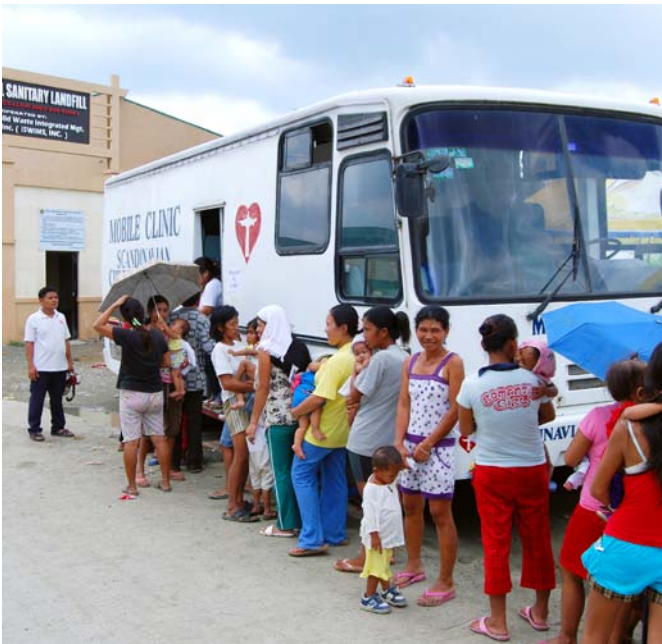
Den mobile lægeklinik er på besøg.