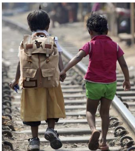
På vej til skole. Nu er sporet lagt til en bedre fremtid.

Vi har fået en helt overvældende positiv respons både fra myndighederne i Bangladesh og fra musikkonservatoriet