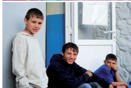
Takket være vores midlertidige opholdssteder får de unge en ny chance i livet.