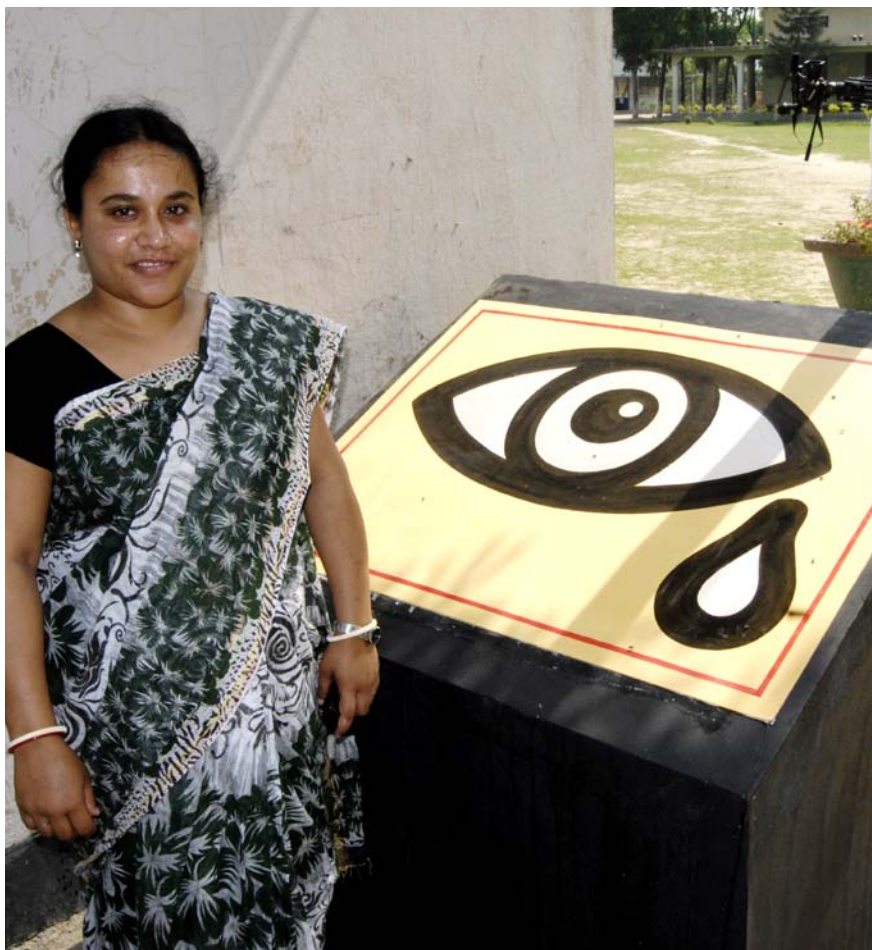
Det første som møder alle besøgende i Home of Peace er Children's Missions symbol for No Corruption Generation.

Hjælpesendingerne løber op i en totalvægt på 280 ton om året. Det er noget, som gør en stor forskel for vores lokale samarbejdspartnere. ■