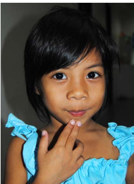
Det er skønt at have fået et hjem.

billede af hele familien, sætter børnene sig trygt hen i hendes favn.