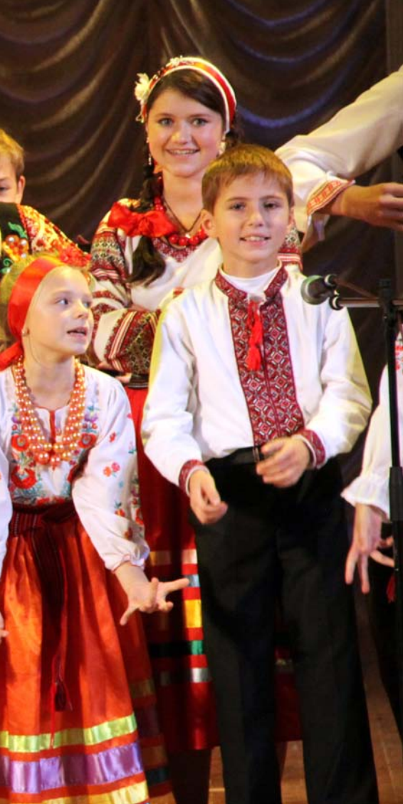
Der var mange dygtige børn, som optrådte ved 20-års jubilæet i Lutsk.

under eftervirkningerne fra atomulykken i Tjernobyl) eller underernærede børn, som behøver at komme til kræfter igen under sommeropholdet i Dubechno. Herud over støtter Children's Mission nogle skoler og lejrsteder i Ukraine, som tilbyder sommerophold til andre 1.700 børn, som også behøver hjælp.