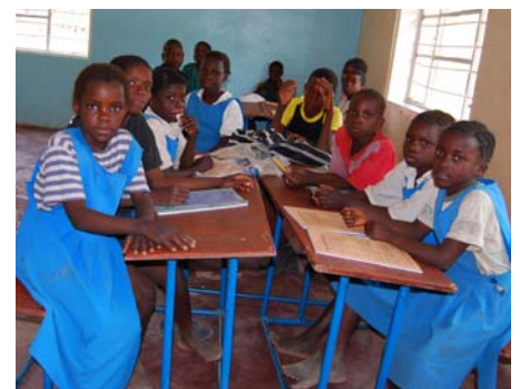
Nogle forventningsfulde elever i vores byskole.

Hele arbejdet hviler på et klart kristent grundlag. ■