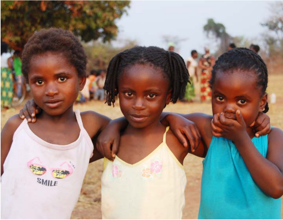
Tre små piger venter spændt på ugens begivenhed da vort fodboldshold skal spille kamp i byen.