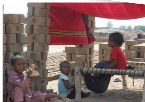
Fra solopgang til solnedgang arbejder både børn og voksne med at fremstille mursten. De bor i simple bosteder tæt på fabrikkerne.