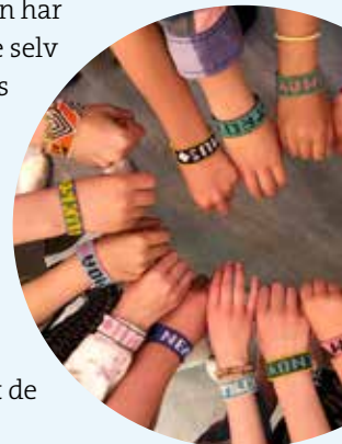
Armbånd som bestiltes til en skoleklasse i den svenske by, Umeå.

Hver mandag mødes gruppen til bøn og bibelstudier. De får også undervisning i computerfærdigheder, bogføring og iværksætteri. Udfordringerne er mange, men med støtte fra Children's Mission har kvinderne fået håb for fremtiden og en tro på, at de med tiden kan blive helt selvstændige.