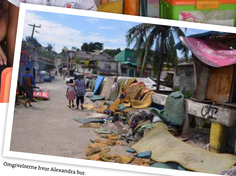
Omgivelserne hvor Alexandra bor.