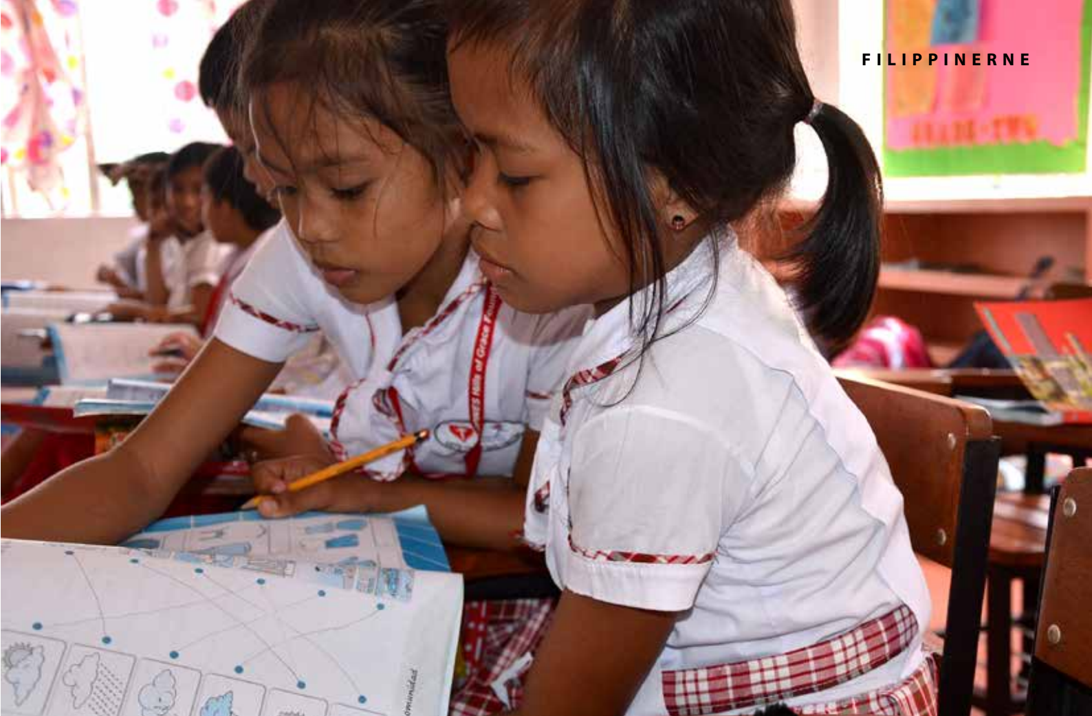
Elever fra Missionens forskoler i dag.