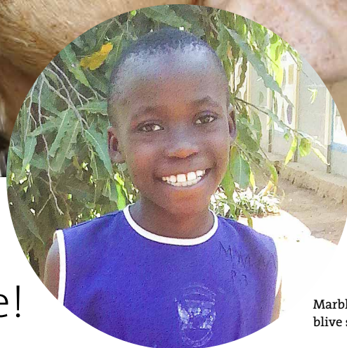
Marble drømmer om at blive sygeplejerske.