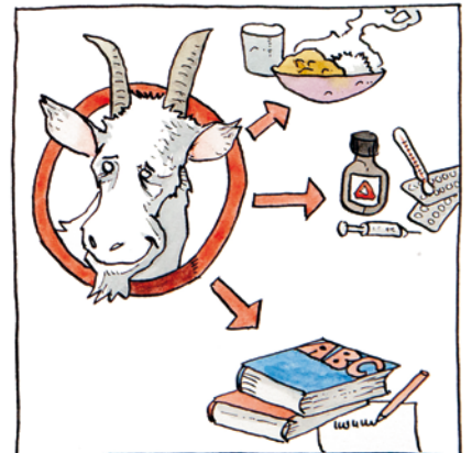
Øverskuddet fra salget går derefter til uddannelse, medicin og mad til familien