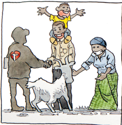
En ged forandrer en nødlidende families livssituation.