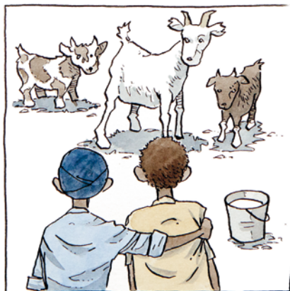
Udover næringsrig mælk, så giver den en indtøgt, når geden får kid, som familien kan sælge