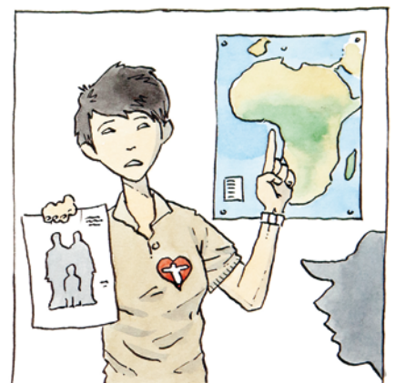
Den kommer til at gå til en fattig familie, i et af de lande hvor Children's Mission arbejder.