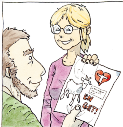
Tillykke med fødselsdagen! En ged som jeg har navngivet med dit navn.