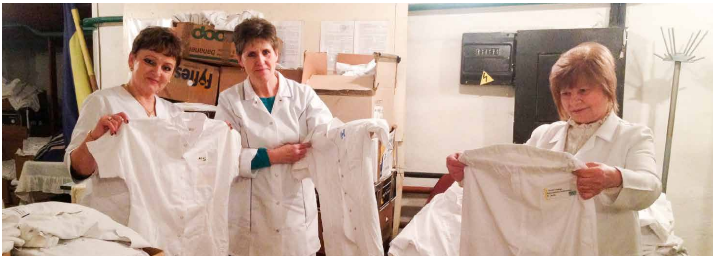
Personalet på kommunehospitalet i Lutsk tæller uniformerne op og fordeler efter anvendelse og størrelse, inden uniformerne distribueres til læger, sygeplejersker og andet sundhedspersonale. Gaven imødekommer et meget stort behov på hospitalet, som er et stort hospital med 1.500 medarbejdere.