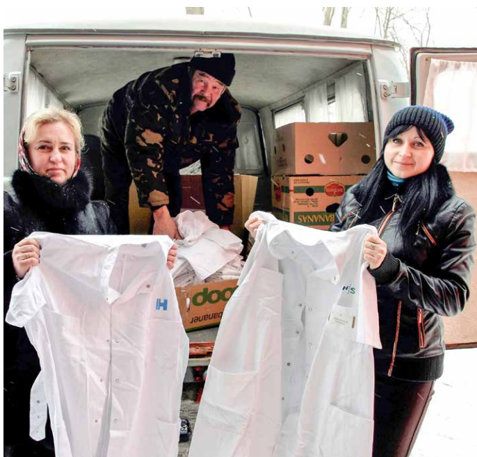
Personalet på tuberkulose hospitalet i Volun Regionen var så begejstrede for at få nye uniformer, at de selv ville være med til at bære dem ind fra vores lastbil.