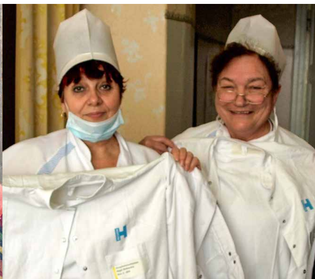
Smilene er store hos både læger og sygeplejerske over gaven. Det er ikke nemt at skulle arbejde mange timer hver dag, og så skulle hjem og vaske hospitalsuniformen hver aften til brug den næste dag.