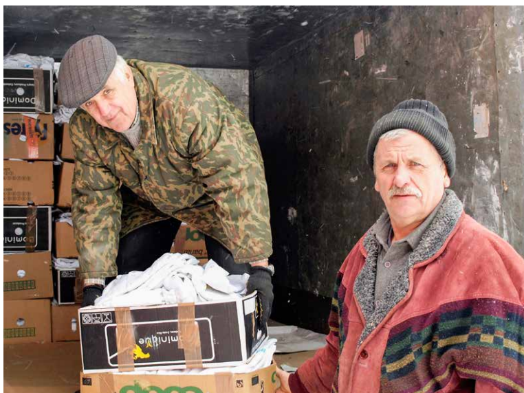
Medarbejdere fra kommunehospitalet i Lutsk hjælper med til at tømme lastbilen for uniformerne.