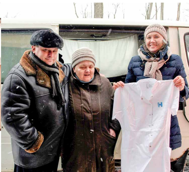
Her er det en af medarbejderne fra en sundhedsklinik i Volun Regionen, som glad viser sin nye uniform frem for vores fotograf. Det gør ikke noget, at der står Region Hovedstaden på uniformerne. Det er de bare stolte af at kunne vise frem.